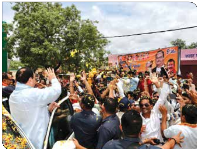
खरगौन (मध्य प्रदेश) में 30 जून, 2023 को एक भव्य रोड शो के दौरान भाजपा राष्ट्रीय अध्यक्ष श्री जगत प्रकाश नड्डा