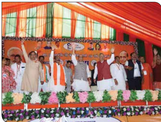
कांकेर (छत्तीसगढ़) में 01 जुलाई, 2023 को एक विशाल जनसभा के दौरान अभिवादन स्वीकार करते रक्षा मंत्री श्री राजनाथ सिंह