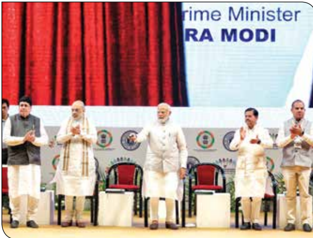
नई दिल्ली में 1 जुलाई, 2023 को 17वीं भारतीय सहकारी कांग्रेस में सहकारी विपणन, सहकारी विस्तार और सलाहकार सेवा पोर्टल के लिए ई-कॉमर्स वेबसाइट का शुभारंभ करते प्रधानमंत्री श्री नरेन्द्र मोदी