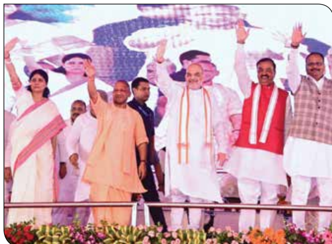
लखनऊ (उत्तर प्रदेश) में 02 जुलाई, 2023 को डॉ. सोनेलाल पटेल जी की 74वीं जयंती के अवसर पर 'जन स्वाभिमान दिवस' कार्यक्रम के दौरान अभिवादन स्वीकार करते केंद्रीय गृह एवं सहकारिता मंत्री श्री अमित शाह