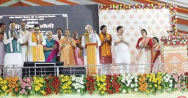
वाराणसी, उत्तर प्रदेश

प्र धानमंत्री श्री नरेन्द्र मोदी ने सात जुलाई को वाराणसी, उत्तर प्रदेश में 12,100 करोड़ रुपये से ज्यादा की कई विकास परियोजनाओं का उद्घाटन और शिलान्यास किया। इन परियोजनाओं में डेडिकेटेड फ्रेट कॉरिडोर की पंडित दीनदयाल उपाध्याय जंक्शन-सोन नगर रेलवे लाइन, विद्युतीकरण या दोहरीकरण पूरा होने के बाद तीन रेलवे लाइनों, एनएच-56 के वाराणसी-जौनपुर खंड का चार-लेन चौड़ीकरण और वाराणसी में कई परियोजना को समर्पित किया जाना शामिल है। इसके अलावा प्रधानमंत्री ने कई परियोजनाओं की आधारशिला भी रखी।