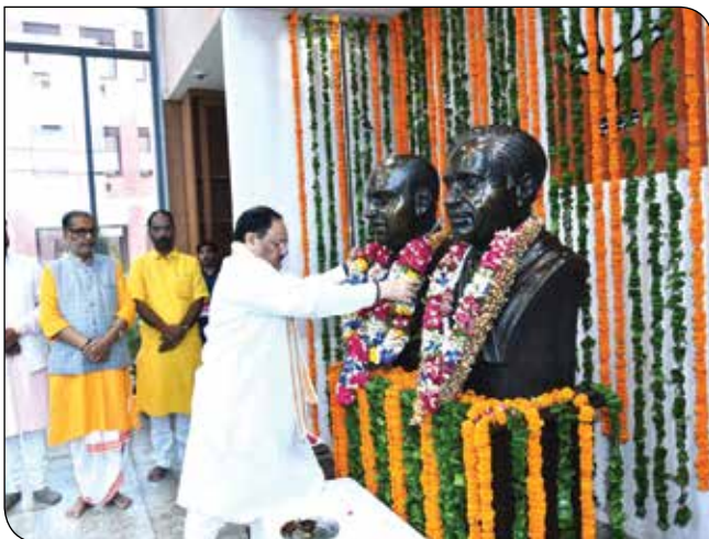
भाजपा मुख्यालय (नई दिल्ली) में 06 जुलाई, 2023 को डॉ. श्यामा प्रसाद मुखर्जी की जयंती पर उन्हें पुष्पांजलि अर्पित करते भाजपा राष्ट्रीय अध्यक्ष श्री जगत प्रकाश नड्डा