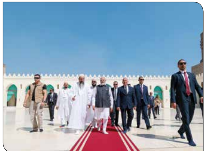
काहिरा (मिस्र) में 25 जून, 2023 को अल-हकीम मस्जिद का भ्रमण करते प्रधानमंत्री श्री नरेन्द्र मोदी