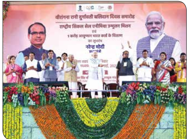
शहडोल (मध्य प्रदेश) में 1 जुलाई, 2023 को राष्ट्रीय सिकल सेल एनीमिया उन्मूलन मिशन का शुभारंभ करते प्रधानमंत्री श्री नरेन्द्र मोदी