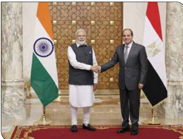
काहिरा (मिस्र) में 25 जून, 2023 को मिस्र के राष्ट्रपति श्री अब्देल फतह अल-सिसी से मुलाकात करते प्रधानमंत्री श्री नरेन्द्र मोदी