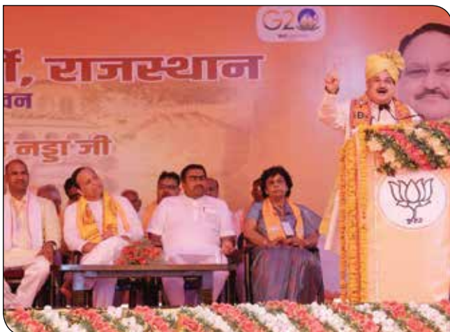
भरतपुर (राजस्थान) में 29 जून, 2023 को भाजपा कार्यालय का उद्घाटन करने के बाद एक विशाल सभा को संबोधित करते भाजपा राष्ट्रीय अध्यक्ष श्री जगत प्रकाश नड्डा