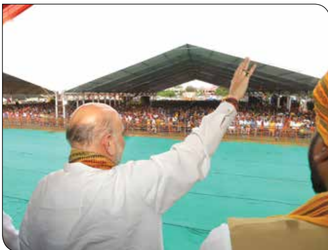
लखीसराय (बिहार) में 29 जून, 2023 को एक विशाल जनसभा को संबोधित करने के बाद जनता का अभिवादन स्वीकार करते केंद्रीय गृह एवं सहकारिता मंत्री श्री अमित शाह