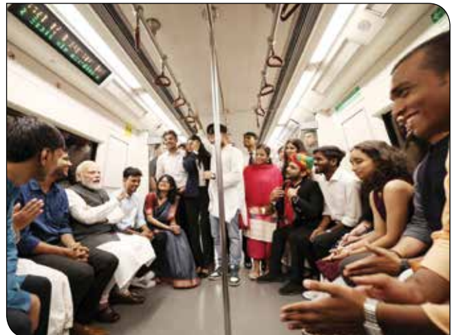
नई दिल्ली में 30 जून, 2023 को दिल्ली विश्वविद्यालय के शताब्दी समारोह में शामिल होने के लिए जाते वक्त दिल्ली मेट्रो में लोगों के साथ बातचीत करते प्रधानमंत्री श्री नरेन्द्र मोदी