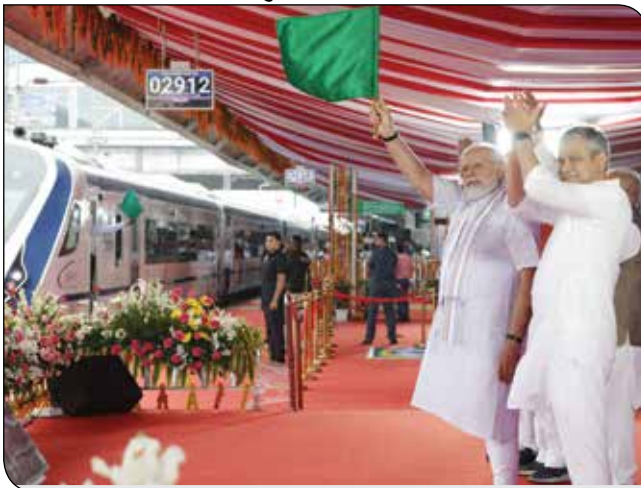
भोपाल (मध्य प्रदेश) में 27 जून, 2023 को रानी कमलापति रेलवे स्टेशन से 5 नयी वंदे भारत एक्सप्रेस को हरी झंडी दिखाते प्रधानमंत्री श्री नरेन्द्र मोदी