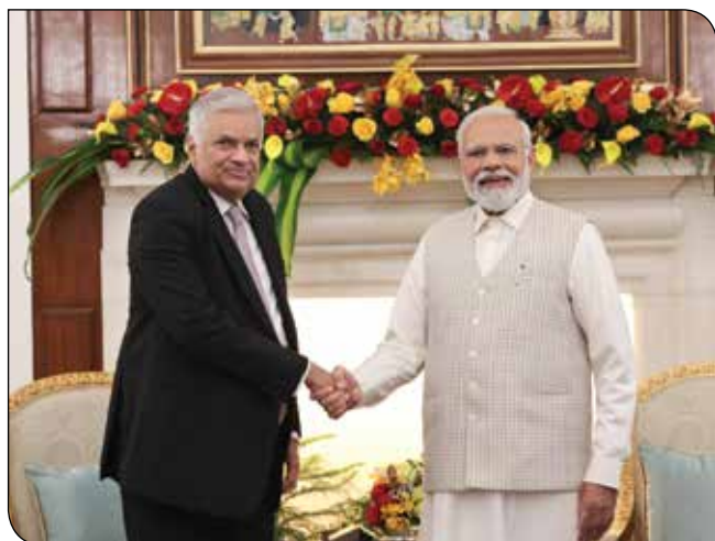
नई दिल्ली में 21 जुलाई, 2023 को श्रीलंका के राष्ट्रपति श्री रानिल विक्रमसिंघे से भेंट करते प्रधानमंत्री श्री नरेन्द्र मोदी