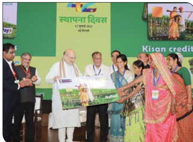
नई दिल्ली में 19 जुलाई, 2023 को नाबार्ड के 42वें स्थापना दिवस पर माइक्रो एटीएम और 'रुपे किसान क्रेडिट कार्ड' वितरित करते केंद्रीय गृह एवं सहकारिता मंत्री श्री अमित शाह