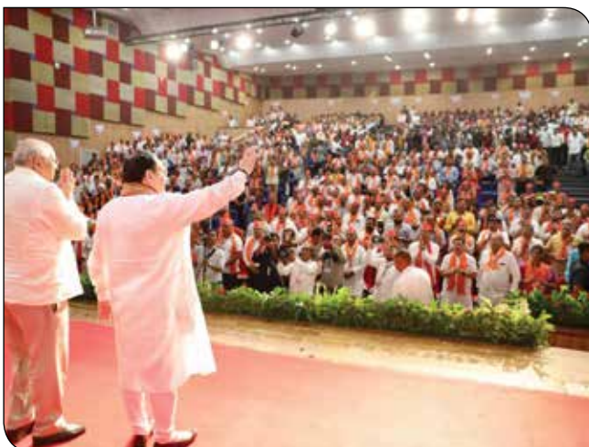
वडोदरा (गुजरात) में 10 जुलाई, 2023 को 'कार्यकर्ता संवाद' कार्यक्रम में जनाभिवादन स्वीकार करते भाजपा राष्ट्रीय अध्यक्ष श्री जगत प्रकाश नड्डा और गुजरात के मुख्यमंत्री श्री भूपेन्द्र भाई पटेल