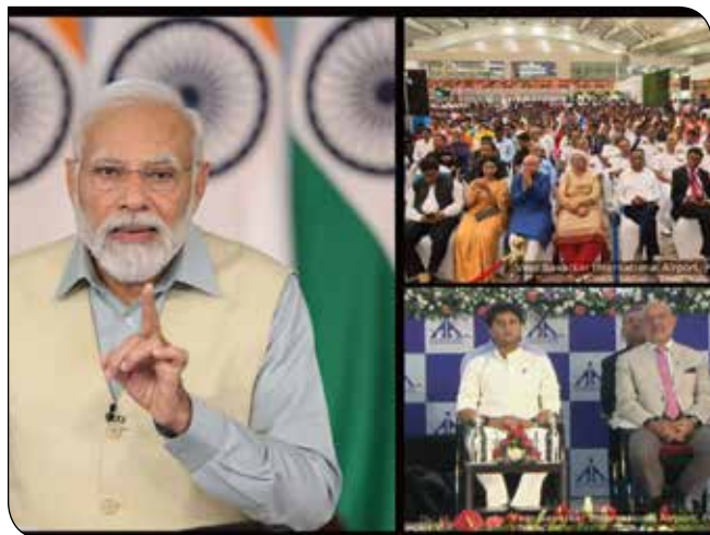
पोर्ट ब्लेयर में 18 जुलाई, 2023 को वीर सावरकर अंतरराष्ट्रीय हवाई अड्डे के नए एकीकृत टर्मिनल भवन के उद्घाटन कार्यक्रम को संबोधित करते प्रधानमंत्री श्री नरेन्द्र मोदी