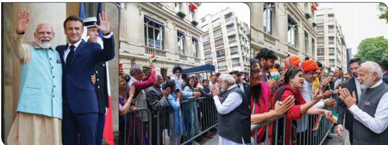
पेरिस (फ्रांस) में 13 जुलाई, 2023 को प्रधानमंत्री श्री नरेन्द्र मोदी के आगमन पर स्वागत करते फ्रांस के राष्ट्रपति श्री इमैनुएल मैक्रों और भारतीय समुदाय