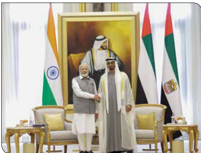
अबू धाबी (संयुक्त अरब अमीरात) में 15 जुलाई, 2023 को कसर ऐ-वतन (राष्ट्रपति महल) में संयुक्त अरब अमीरात के राष्ट्रपति श्री शेख मोहम्मद बिन जायद अल नाहयान से मुलाकात करते प्रधानमंत्री श्री नरेन्द्र मोदी