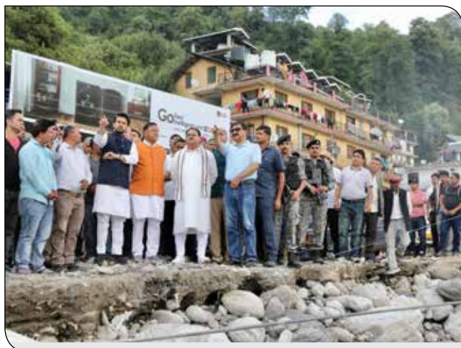
हिमाचल प्रदेश में 14 जुलाई, 2023 को बाढ़ प्रभावित क्षेत्रों का दौरा करते भाजपा राष्ट्रीय अध्यक्ष श्री जगत प्रकाश नड्डा और अन्य भाजपा नेतागण