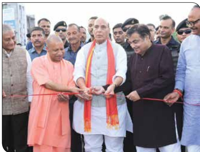
लखनऊ (उत्तर प्रदेश) में 17 जुलाई, 2023 को विभिन्न विकास परियोजनाओं का उद्घाटन करते केंद्रीय मंत्री श्री राजनाथ सिंह, श्री नितिन गडकरी और उत्तर प्रदेश के मुख्यमंत्री श्री योगी आदित्यनाथ