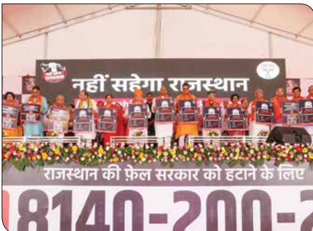
जयपुर (राजस्थान) में 16 जुलाई, 2023 को 'नहीं सहेगा राजस्थान' अभियान का शुभारंभ करते भाजपा राष्ट्रीय अध्यक्ष श्री जगत प्रकाश नड्डा