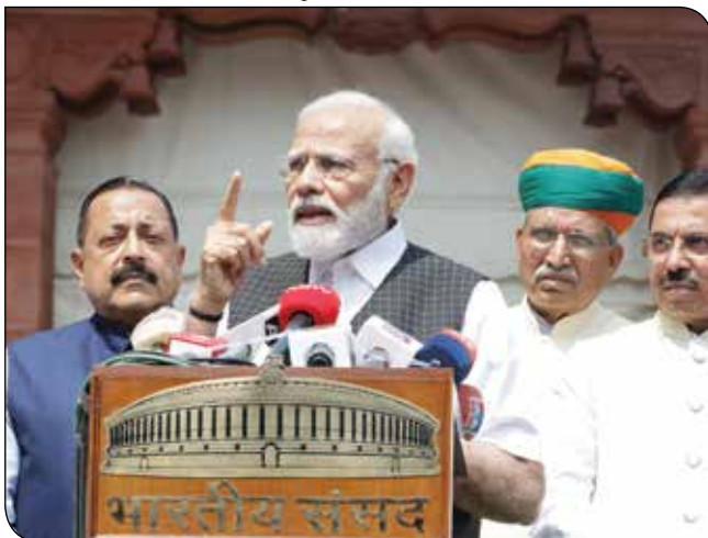
नई दिल्ली में 20 जुलाई, 2023 को संसद के मानसून सत्र 2023 की शुरुआत से पहले मीडिया को संबोधित करते प्रधानमंत्री श्री नरेन्द्र मोदी