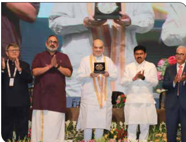
गुरुग्राम (हरियाणा) में 13 जुलाई, 2023 को आयोजित 'एनएफटी, एआई और मेटावर्स के युग में अपराध और सुरक्षा पर जी20 सम्मेलन' के दौरान केंद्रीय गृह और सहकारिता मंत्री श्री अमित शाह