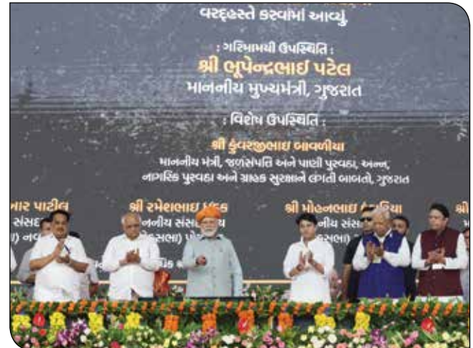
राजकोट (गुजरात) में 27 जुलाई, 2023 को विभिन्न विकास परियोजनाओं का उद्घाटन करते प्रधानमंत्री श्री नरेन्द्र मोदी