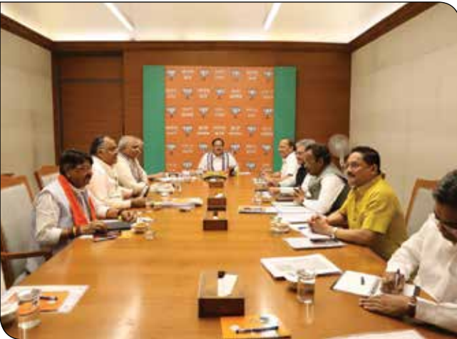
भाजपा मुख्यालय (नई दिल्ली) में 28 जुलाई, 2023 को भाजपा राष्ट्रीय महामंत्रियों की बैठक की अध्यक्षता करते भाजपा राष्ट्रीय अध्यक्ष श्री जगत प्रकाश नड्डा