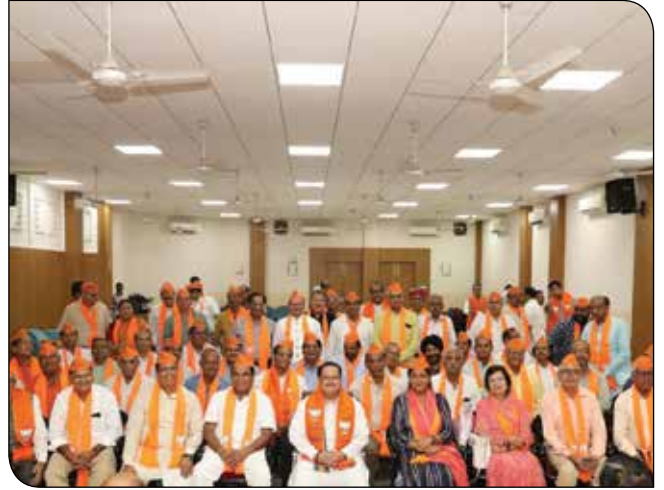
जयपुर (राजस्थान) में 29 जुलाई, 2023 को प्रदेश भाजपा के वरिष्ठ कार्यकर्ताओं के साथ बातचीत करते पार्टी के राष्ट्रीय अध्यक्ष श्री जगत प्रकाश नड्डा