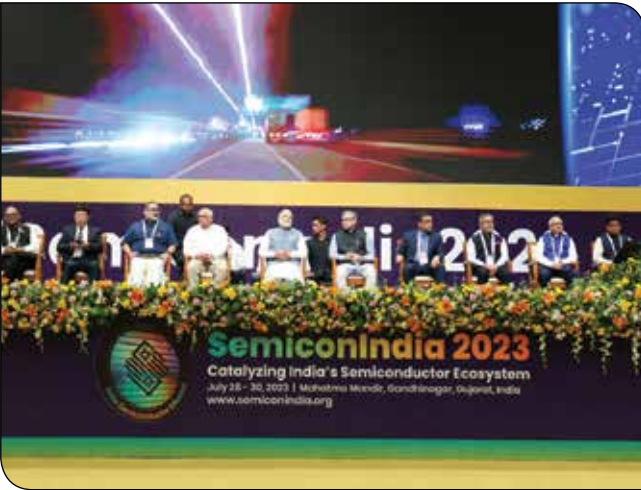
गांधीनगर (गुजरात) में 28 जुलाई, 2023 को 'सेमीकॉन इंडिया 2023' के उद्घाटन सत्र के अवसर पर प्रधानमंत्री श्री नरेन्द्र मोदी