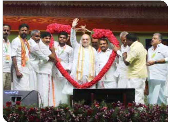
रामनाथपुरम में 28 जुलाई, 2023 को तमिलनाडु भाजपा द्वारा आयोजित 'एन मन, एन मक्कल' यात्रा के शुभारंभ के अवसर पर केंद्रीय गृह एवं सहकारिता मंत्री श्री अमित शाह