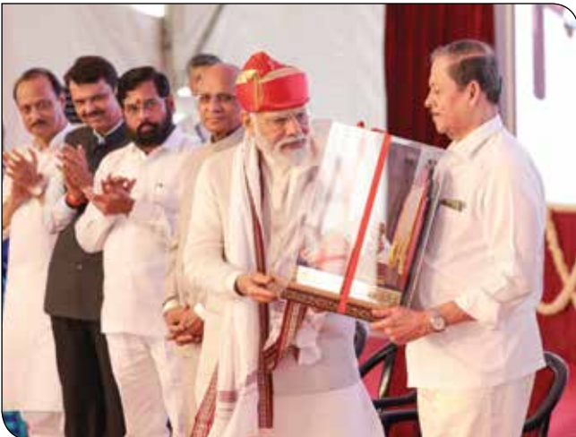
पुणे (महाराष्ट्र) में 01 अगस्त, 2023 को लोकमान्य तिलक राष्ट्रीय पुरस्कार प्राप्त करते प्रधानमंत्री श्री नरेन्द्र मोदी