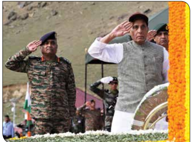
द्रास में 26 जुलाई, 2023 को 'कारगिल विजय दिवस' के अवसर पर भारत के बहादुरों को श्रद्धांजलि अर्पित करते रक्षा मंत्री श्री राजनाथ सिंह