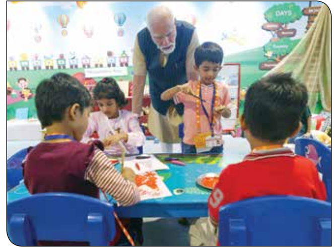
नई दिल्ली में 29 जुलाई, 2023 को भारत मंडपम में आयोजित अखिल भारतीय शिक्षा समागम के दौरान बच्चों के साथ बातचीत करते प्रधानमंत्री श्री नरेन्द्र मोदी