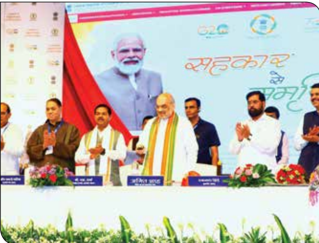
पुणे में 6 अगस्त, 2023 को सहकारी समितियों के संचालन को सरल बनाने के लिए 'डिजिटल पोर्टल' का शुभारंभ करते केंद्रीय गृह एवं सहकारिता मंत्री श्री अमित शाह