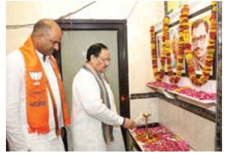
राजस्थान: भाजपा के पक्ष में जनता वलीन स्वीप करने को तैयार