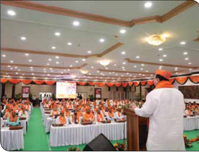
सूरजकुंड (हरियाणा) में 7 अगस्त, 2023 को आयोजित 'क्षेत्रीय पंचायती राज परिषद्' के उद्घाटन सत्र में प्रतिभागियों को संबोधित करते भाजपा राष्ट्रीय अध्यक्ष श्री जगत प्रकाश नड्डा