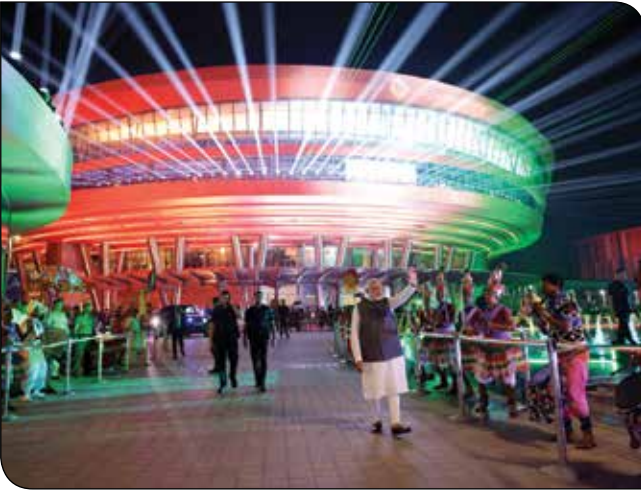
प्रगति मैदान (नई दिल्ली) में 26 जुलाई, 2023 को अंतरराष्ट्रीय प्रदर्शनी-सह-सम्मेलन केंद्र परिसर 'भारत मंडपम' के उद्घाटन के अवसर पर प्रधानमंत्री श्री नरेन्द्र मोदी