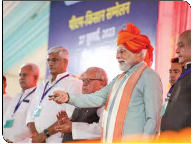
27 जुलाई, 2023 को सीकर (राजस्थान) में विभिन्न विकास परियोजनाओं की आधारशिला रखते प्रधानमंत्री श्री नरेन्द्र मोदी