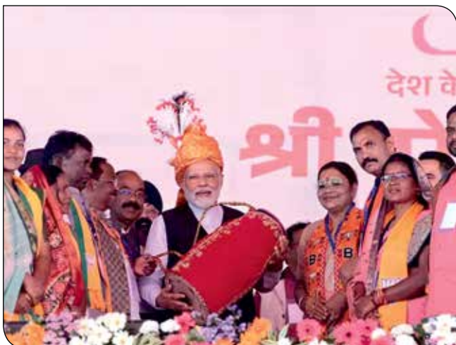
सीधी (मध्य प्रदेश) में 07 नवंबर, 2023 को एक विशाल जनसभा के दौरान प्रधानमंत्री श्री नरेन्द्र मोदी