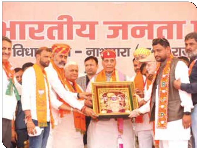
नाथद्वारा में 03 नवंबर, 2023 को एक विशाल चुनावी रैली के दौरान रक्षा मंत्री श्री राजनाथ सिंह का स्वागत करते राजस्थान भाजपा के पदाधिकारीगण