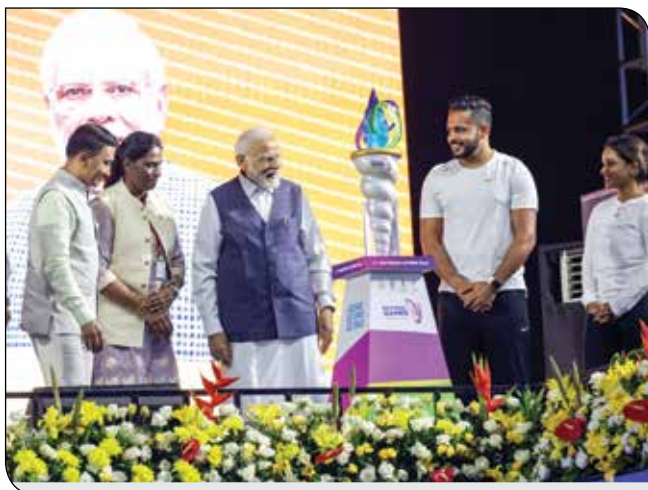
मडगांव (गोवा) में 26 अक्टूबर, 2023 को पंडित जवाहरलाल नेहरू स्टेडियम में 37वें राष्ट्रीय खेलों का उद्घाटन करते प्रधानमंत्री श्री नरेन्द्र मोदी