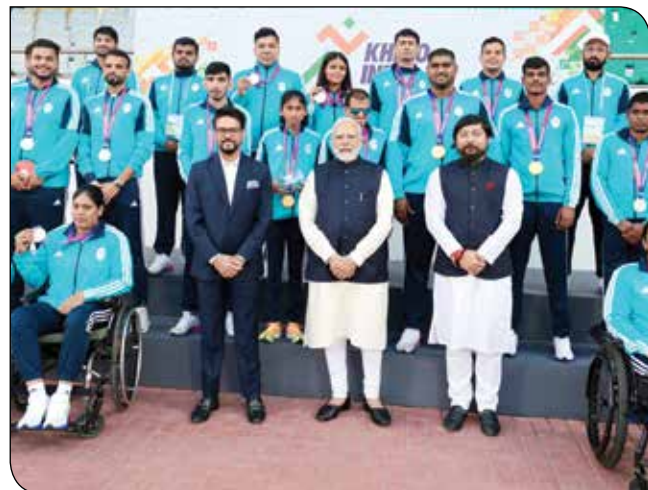
मेजर ध्यानचंद नेशनल स्टेडियम (नई दिल्ली) में 01 नवंबर, 2023 को एशियाई पैरा खेलों के लिए भारतीय दल के साथ एक समूह चित्र में प्रधानमंत्री श्री नरेन्द्र मोदी