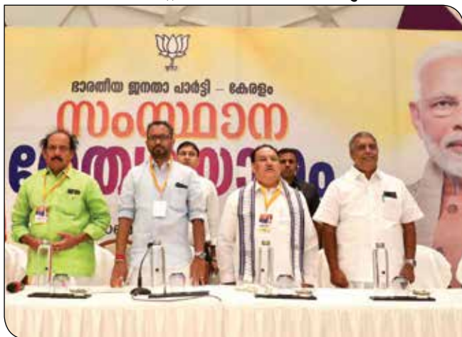
तिरुवनंतपुरम (केरल) में 30 अक्टूबर, 2023 को भाजपा प्रदेश नेतृत्व बैठक को संबोधित करते भाजपा राष्ट्रीय अध्यक्ष श्री जगत प्रकाश नड्डा