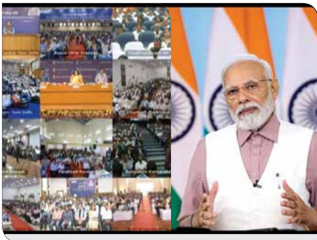
नई दिल्ली से 28 अक्टूबर, 2023 को राष्ट्रीय रोजगार मेले को संबोधित करते प्रधानमंत्री श्री नरेन्द्र मोदी