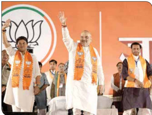
ग्वालियर (मध्य प्रदेश) में 04 नवंबर, 2023 को एक विशाल जनसभा में जनाभिवादन स्वीकार करते केंद्रीय गृह एवं सहकारिता मंत्री श्री अमित शाह