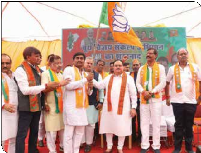
वार्ड नंबर 52, रायपुर (छत्तीसगढ़) में 29 अक्टूबर, 2023 को 'बूथ संकल्प अभियान' के शुभारंभ अवसर पर भाजपा राष्ट्रीय अध्यक्ष श्री जगत प्रकाश नड्डा