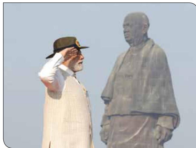
केवडिया (गुजरात) में 31 अक्टूबर, 2023 राष्ट्रीय एकता दिवस परेड में सम्मिलित होते प्रधानमंत्री श्री नरेन्द्र मोदी