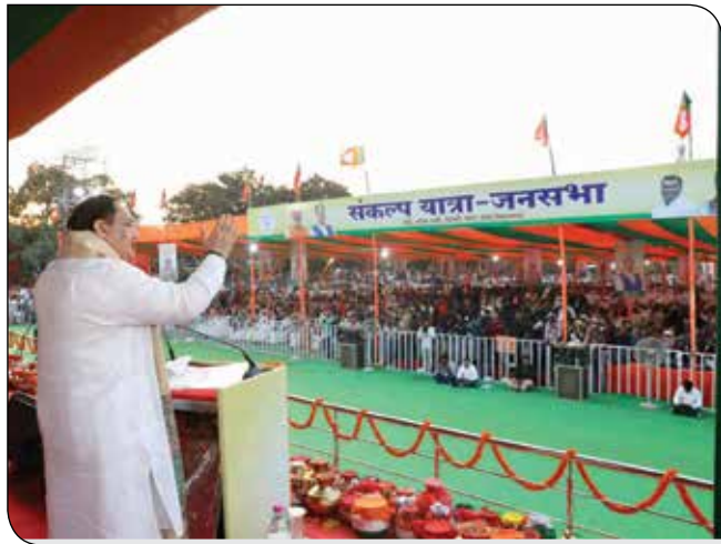
रांची (झारखंड) में 28 अक्टूबर, 2023 को 'संकल्प यात्रा समर्पण समारोह' को संबोधित करते भाजपा राष्ट्रीय अध्यक्ष श्री जगत प्रकाश नड्डा