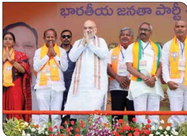
सूर्यपेट (तेलंगाना) में 27 अक्टूबर, 2023 को 'जन गर्जना रैली' में जनाभिवादन स्वीकार करते केंद्रीय गृह एवं सहकारिता मंत्री श्री अमित शाह