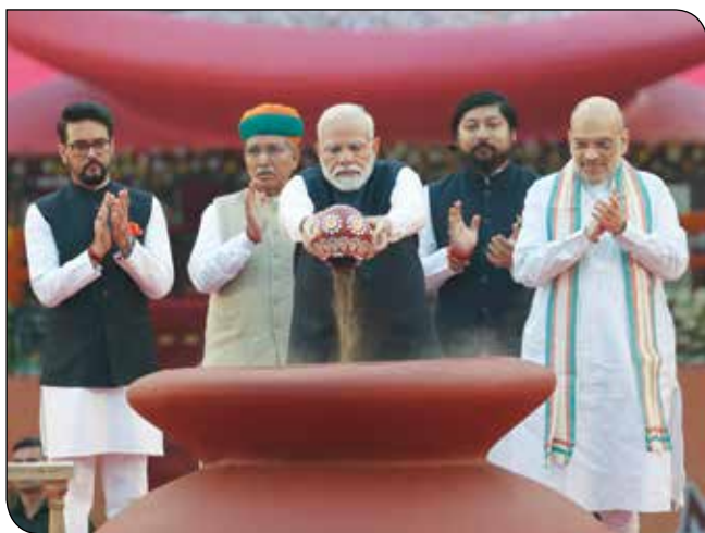
कर्तव्य पथ (नई दिल्ली) में 31 अक्टूबर, 2023 को 'मेरी माटी मेरा देश अभियान' के तहत अमृत कलश यात्रा समापन के अवसर पर आयोजित कार्यक्रम के दौरान प्रधानमंत्री श्री नरेन्द्र मोदी