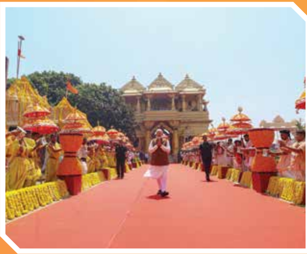
सोमनाथ मंदिर (गुजरात) में 11 मई, 2026 को आयोजित 'सोमनाथ अमृत महोत्सव' में शामिल होते प्रधानमंत्री श्री नरेन्द्र मोदी