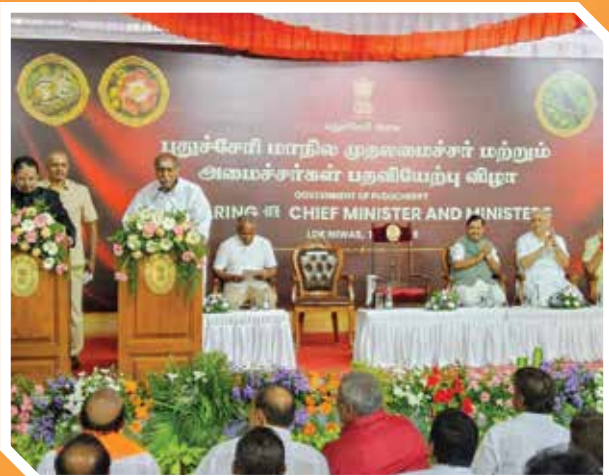
पुदुचेरी में 13 मई, 2026 को एनडीए नेता श्री एन. रंगासामी के शपथ ग्रहण समारोह में शामिल होते भाजपा राष्ट्रीय अध्यक्ष श्री नितिन नवीन, भाजपा राष्ट्रीय महामंत्री (संगठन) श्री बी.एल. संतोष एवं अन्य वरिष्ठ नेतागण