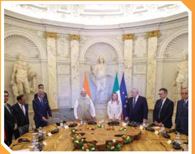
रोम (इटली) में 20 मई, 2026 को इटली की प्रधानमंत्री सुश्री जॉर्जिया मेलोनी के साथ द्विपक्षीय वार्ता करते प्रधानमंत्री श्री नरेन्द्र मोदी