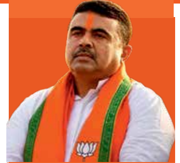
श्री शुभेंदु अधिकारी जीवन परिचय