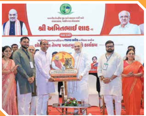
गांधीनगर (गुजरात) में 18 मई, 2026 को विभिन्न विकास परियोजनाओं का उद्घाटन एवं शिलान्यास करते केंद्रीय गृह एवं सहकारिता मंत्री श्री अमित शाह