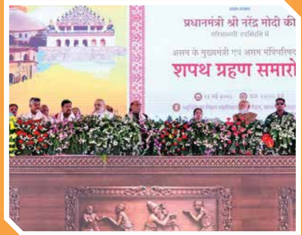
गुवाहाटी में 12 मई, 2026 को असम सरकार के शपथ ग्रहण समारोह में सम्मिलित होते प्रधानमंत्री श्री नरेन्द्र मोदी, भाजपा राष्ट्रीय अध्यक्ष श्री नितिन नवीन, केंद्रीय मंत्री श्री राजनाथ सिंह, श्री अमित शाह एवं अन्य वरिष्ठ नेतागण