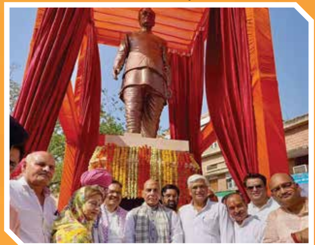
जोधपुर (राजस्थान) में 14 मई, 2026 को भारत के पूर्व उपराष्ट्रपति एवं वरिष्ठ भाजपा नेता श्री भैरों सिंह शेखावत की प्रतिमा का अनावरण करते रक्षा मंत्री श्री राजनाथ सिंह