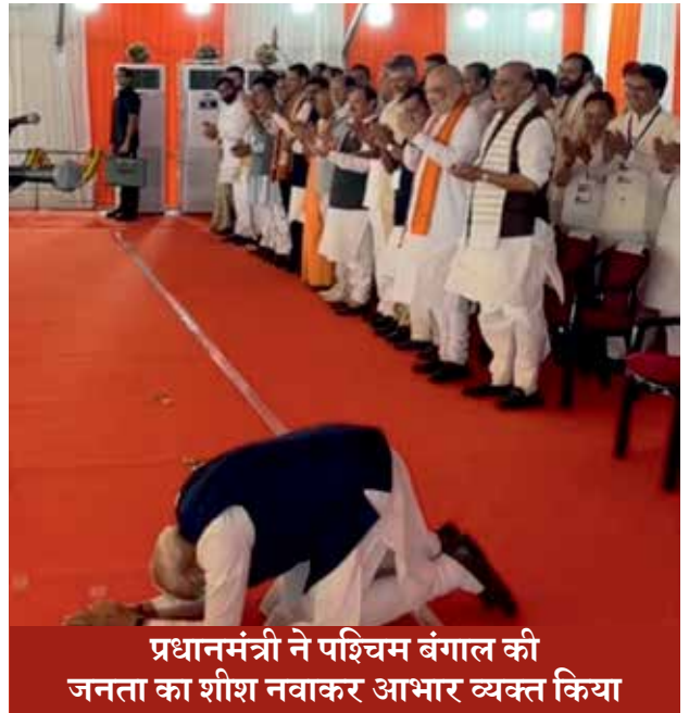
प्रधानमंत्री ने पश्चिम बंगाल की जनता का शीश नवाकर आभार व्यक्त किया

पश्चिम बंगाल में भाजपा सरकार का गठन व्यापक रूप से लंबे समय से परिकल्पित ‘सोनार बांग्ला’ युग की शुरुआत के रूप में देखा जा रहा है। अब जब भाजपा केंद्र और पश्चिम बंगाल, दोनों जगहों पर शासन में है, तो यह ‘डबल-इंजन सरकार’ राज्य में त्वरित विकास, आधुनिक बुनियादी ढांचे, पारदर्शी शासन, महिलाओं की