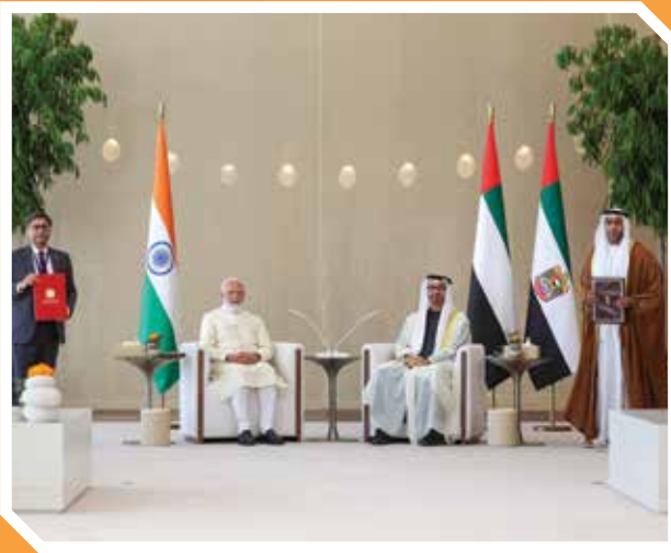
अबू धाबी (यूएई) में 15 मई, 2026 को भारत एवं यूएई के बीच समझौता ज्ञापनों के आदान-प्रदान के साक्षी बनते प्रधानमंत्री श्री नरेन्द्र मोदी एवं संयुक्त अरब अमीरात के राष्ट्रपति शेख मोहम्मद बिन ज़ायेद अल नाहयान