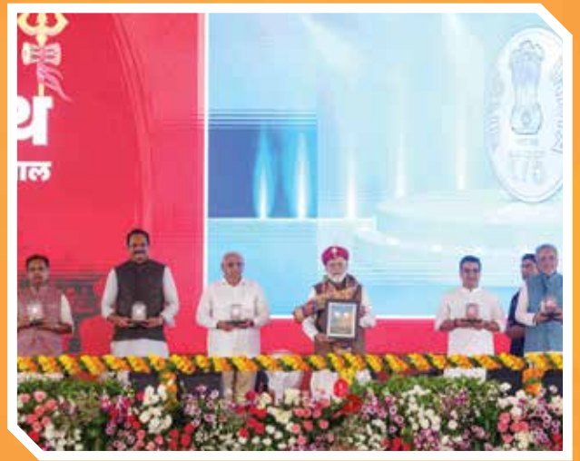
सोमनाथ मंदिर (गुजरात) में 11 मई, 2026 को आयोजित 'सोमनाथ अमृत महोत्सव' के अवसर पर स्मारक डाक टिकट एवं विशेष सिक्के जारी करते प्रधानमंत्री श्री नरेन्द्र मोदी