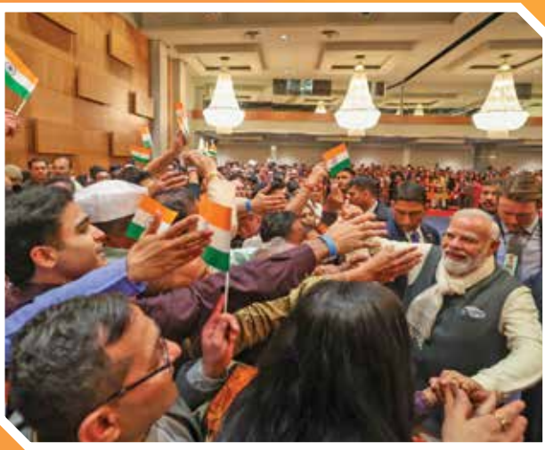
नॉर्वे में 18 मई, 2026 को प्रधानमंत्री श्री नरेन्द्र मोदी का गर्मजोशी से स्वागत करते भारतीय समुदाय के लोग