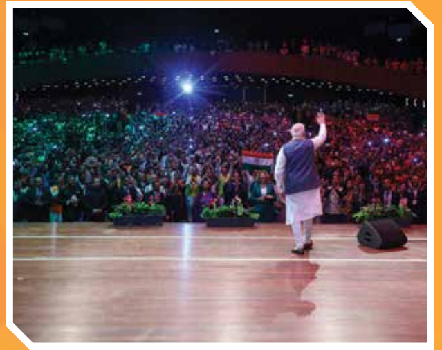
द हेग (नीदरलैंड्स) में 16 मई, 2026 को एक कार्यक्रम में प्रधानमंत्री श्री नरेन्द्र मोदी का भव्य स्वागत करता भारतीय समुदाय