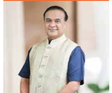
डॉ. हिमंत बिश्व शर्मा जीवन परिचय