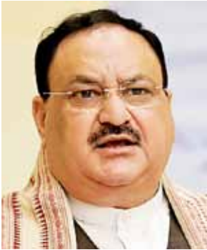
जगत प्रकाश नड्डा