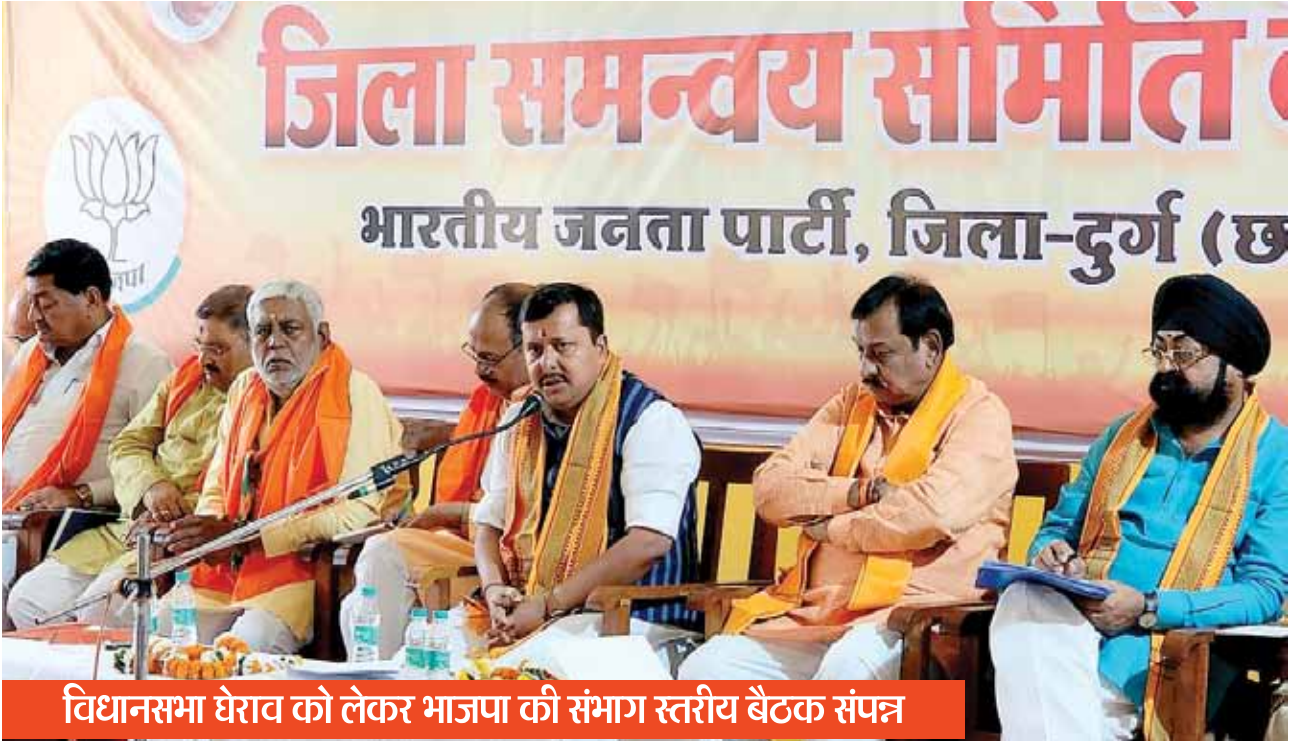
विधानसभा घेराव को लेकर भाजपा की संभाग स्तरीय बैठक संपन्न