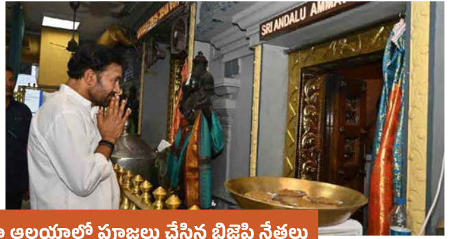
ప్రధాని మోదీ ఆయురారోగ్యాలు కాంక్షిస్తూ అలయాల్లో పూజలు చేసిన బిజెపి నేతలు