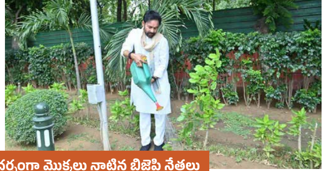
ప్రపంచ పర్యావరణ దినోత్సవం సందర్భంగా మొక్కలు నాటిన బిజెపి నేతలు