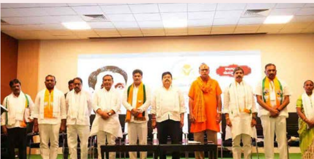
మే 30న కరీంనగర్ లో నిర్వహించిన కరీంనగర్ జిల్లా బిజెపి ప్రశిక్షణా తరగతుల్లో ప్రసంగిస్తున్న బిజెపి తెలంగాణ రాష్ట్ర అధ్యక్షుడు ఎన్. రాంచందర్ రావు