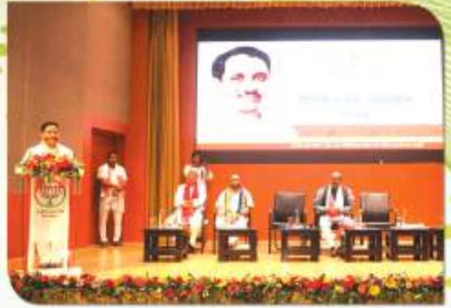
বিজেপির বাজিক কার্যালয়ত অনুষ্ঠিত পণ্ডিত দীনদয়াল উপাধ্যায় প্রশিক্ষণ মহা অভিযান ২০২৬ ৰ এক দৃশ্যাংশ