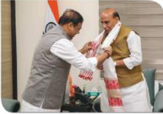
কেন্দ্ৰীয় প্ৰতিবন্ধা মন্ত্ৰী মাননীয় শ্ৰীযুত বাজনাথ সিং ডাঙৰীয়াক সাক্ষাৎ অসমৰ মাননীয় মুখ্যমন্ত্ৰী ড° হিমন্ত বিশ্ব শৰ্মা ডাঙৰীয়াৰ