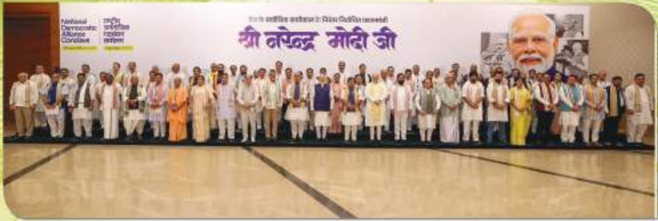
প্রধানমন্ত্রী শ্রীযুত নরেন্দ্র মোদীৰ নেতৃত্বত এন.ডি.এ চৰকাৰৰ ১২ বছৰ সম্পূৰ্ণ হোৱাৰ উপলক্ষে আয়োজিত অধিবেশনত অংশগ্ৰহণ কৰা এন.ডি.এ মিত্ৰজোঁটৰ নেতৃবৰ্গ