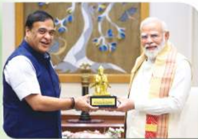
নতুন দিল্লীত মাননীয় প্ৰধানমন্ত্ৰী শ্ৰীযুত নবজি মৌদী ডাঙৰীয়াক সাক্ষাৎ অসমৰ মাননীয় মুখ্যমন্ত্ৰী ড° হিমন্ত বিশ্ব ডাঙৰীয়া