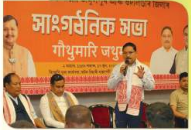
বি.টি.চি.-ৰ কৰ্ণধাৰ সমিতিৰ বেঠকত ভাষণ প্ৰদান কৰে ৰাজ্যিক সভাপতি মাননীয় দিলীপ শইকীয়া ডাঙৰীয়া