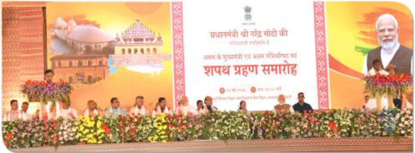
प्रधानमंत्री श्रीवृत् नरेन्द्र मोदी डाउबीया आक एन.डि.ए मित्रजोटीब बास्तीय नेतृद्वर पवित्र उपस्थिति त ड° हिमन्त विश्व शर्मा डाउबीयाब द्वितीयको कार्यकालब शपत ग्रहण अनुष्ठान