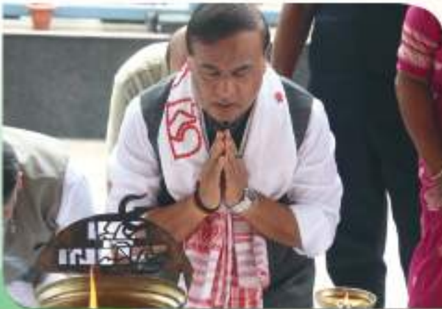
অসমৰ জনপ্ৰিয় শিল্পী হিয়াৰ আমঠু জুবিন গাৰ্গৰ পবিত্ৰ সমাধিক্ষেত্ৰত সেৱা জনাই অসমৰ মননীয় মুখ্যমন্ত্ৰী ড° হিমন্ত বিশ্ব শৰ্মা ডাঙৰীয়াই