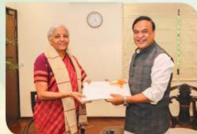
কেন্দ্ৰীয় বিত্তীয় মন্ত্ৰী মাননীয় শ্ৰীযুতা নিৰ্মলা সীতাৰামন ডাঙৰীয়ানিক সাক্ষাৎ অসমৰ মাননীয় মুখ্যমন্ত্ৰী ড° হিমন্ত বিশ্ব শৰ্মা ডাঙৰীয়াৰ