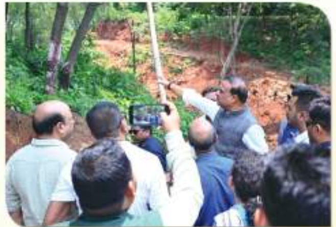
অসমৰ জনপ্ৰিয় শিল্পী হিয়াৰ আমঠু জুবিন গাৰ্গৰ পবিত্ৰ সমাধিক্ষেত্ৰৰ নিৰ্মাণ কাৰ্যৰ অগ্ৰগতিৰ বৃদ্ধি লোৱাৰ মুহূৰ্তত অসমৰ মননীয় মুখ্যমন্ত্ৰী ড° হিমন্ত বিশ্ব শৰ্মা ডাঙৰীয়াই