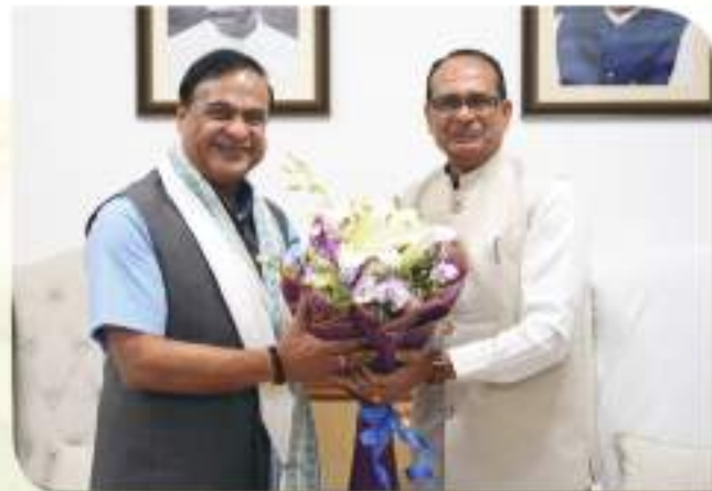
केन्द्रीय मन्त्री माननीय श्रीयुत शिबबाज सिंघु चौहान डाडवीयाक साक्षात् कवा मुहूर्त मुख्यामन्त्री ड॰ हिमन्त विश्व शर्मा डाडवीया