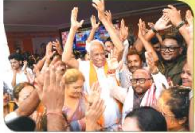
ঐতিহাসিক বিজয়ৰ পিছত দলীয় কাৰ্যকৰ্তাৰ বিজয় উল্লাস