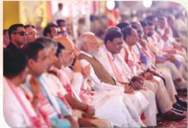
ऐतिहासिक शपत ग्रहण अनुष्ठानब एषन चिबम्बवीर आलोकचित्र