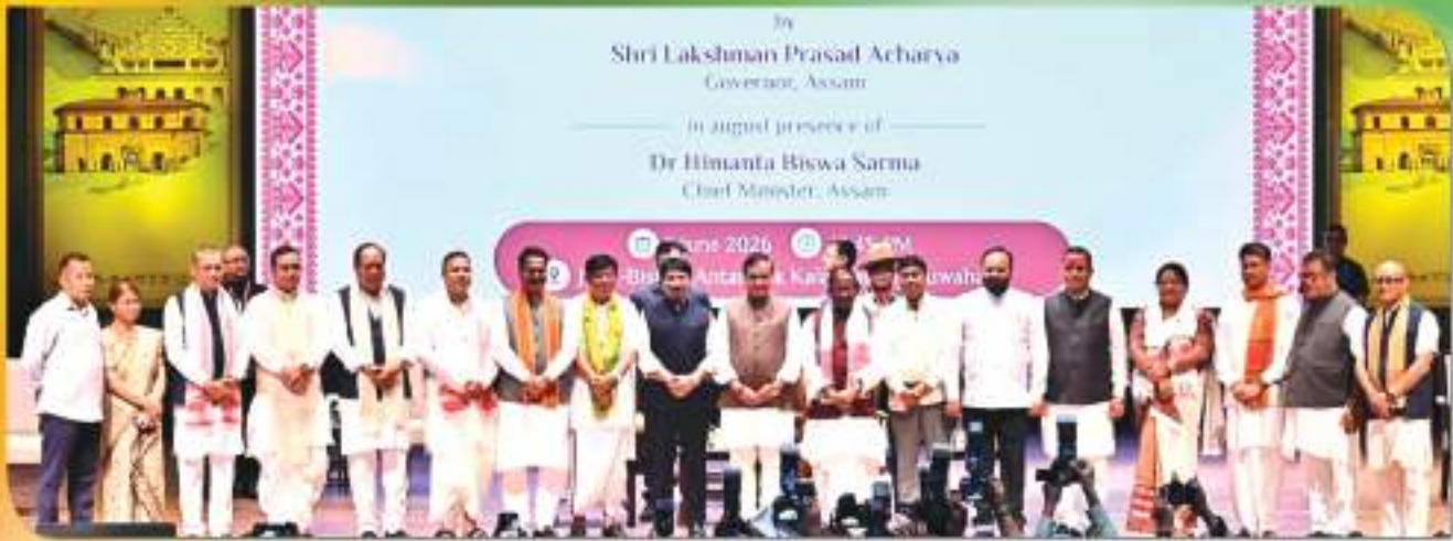
জ্যোতি বিশ্ব কলামন্দিৰ প্ৰেক্ষাগৃহত অনুষ্ঠিত ৰাজ্য চৰকাৰৰ কেবিনেট মন্ত্ৰীসভাৰ আন ১২ গৰাকী মন্ত্ৰীৰ শপত গ্ৰহণ অনুষ্ঠানত উপস্থিত থাকে অসমৰ মহামহিম ৰাজ্যপাল লক্ষণ প্ৰসাদ আৰ্চাঘ আৰু মুখ্যমন্ত্ৰী ড° হিমন্ত বিশ্ব শৰ্মা ডাঙৰীয়াই