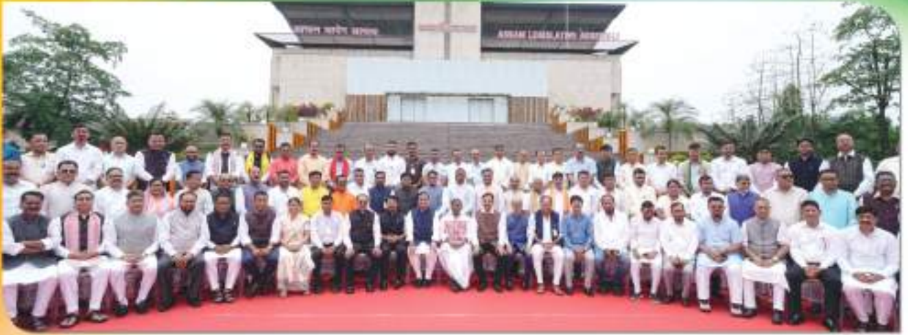
অসম বিধানসভা প্ৰদৰ্শনত অসমৰ মহামহিম ৰাজ্যপাল শ্ৰীযুত লক্ষণ প্ৰসাদ আচাৰ্য আৰু মুখ্যমন্ত্ৰী ড° হিমন্ত বিশ্ব শৰ্মা ডাঙৰীয়াৰ সৈতে অসম বিধানসভাৰ নৱ নিৰ্বাচিত বিধায়ক সকলৰ সন্মিলিত এখন অলোকচিত্ৰ