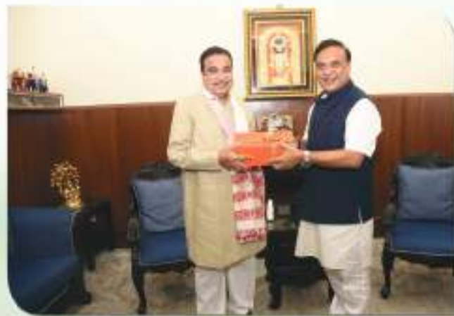
কেন্দ্ৰীয় কেবিনেট মন্ত্ৰী মাননীয় শ্ৰীযুত নিতীন গাডকাৰী ডাঙৰীয়াক সাক্ষাৎ অসমৰ মাননীয় মুখ্যমন্ত্ৰী ড° হিমন্ত বিশ্ব শৰ্মা ডাঙৰীয়াৰ