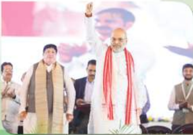
কেন্দ্ৰীয় গৃহমন্ত্ৰী শ্ৰীযুত অমিত শ্বাহ ডাঙৰীয়াই কাৰ্যকৰ্তা সকলক সাধোখন কৰাৰ এক মুহূৰ্ত