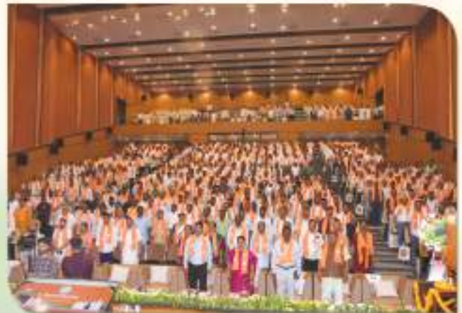
বিজেপি অসম প্ৰদেশৰ দ্বাৰা আয়োজিত বিশেষ সাংগঠনিক সভাত অংশগ্ৰহণ কৰা দলীয় কাৰ্যকৰ্তাবৃন্দ