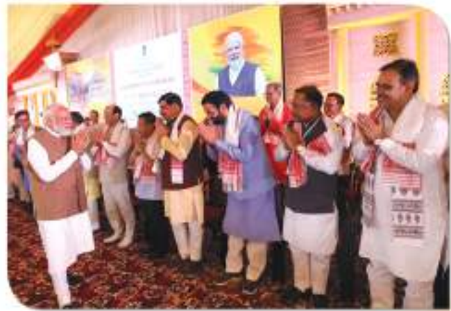
ऐतिहासिक शपत ग्रहण अनुष्ठानत प्रधानमंत्री श्रीवृत् नरेन्द्र मोदी डाउबीयाब सैते केन्द्रीय मन्त्री तथा एन.डि.ए मित्रजोटीब बास्तीय नेतृवृन्द