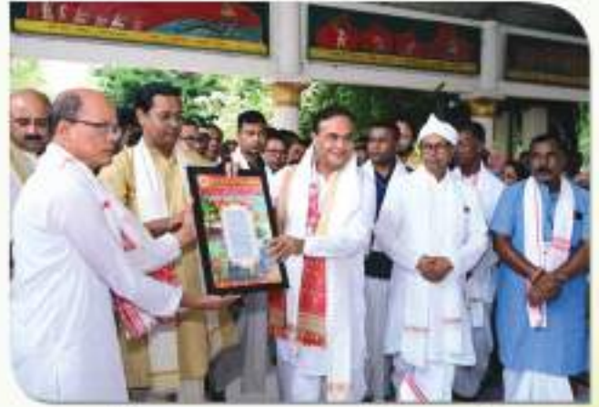
মহাপুৰুষ শ্রীমন্ত শংকৰদেব গুৰুজনাৰ পবিত্ৰ জন্মস্থান বটদ্রবা থানাত উপস্থিত হৈ সেৱা জনাই মাননীয় মুখ্যমন্ত্রী ড° হিমন্ত বিশ্ব শৰ্মাই