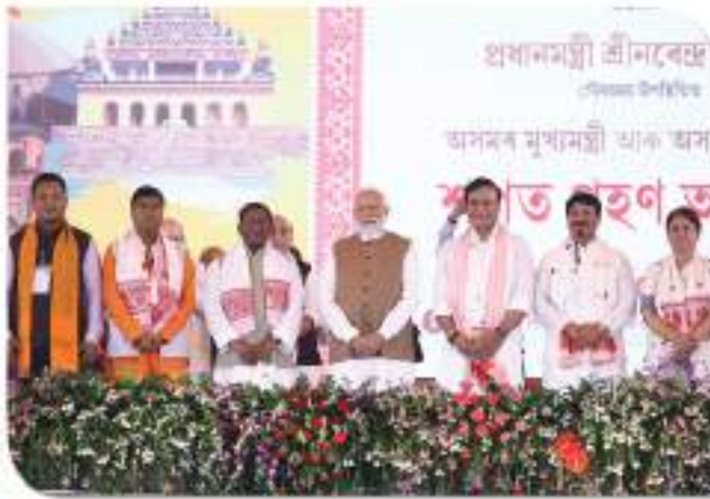
ऐतिहासिक शपत ग्रहण अनुष्ठानत प्रधानमंत्री श्रीवृत् नरेन्द्र मोदी डाउबीयाब आक असमब महामहिम बाङ्गुपाल लक्ष्म प्रसाद आचार्यब सैते माननीय मुख्यामन्त्री ड° हिमन्त विश्व शर्माब लगते एन.डि.ए मित्रजोटीब चर्बिगबाकी नतुन मन्त्री