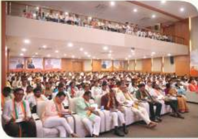
বিজেপির বাজিক কার্যালয়ত অনুষ্ঠিত পণ্ডিত দীনদয়াল উপাধ্যায় প্রশিক্ষণ মহা অভিযান ২০২৬ ৰ দলীয় কার্যকর্তা সকলৰ এক দৃশ্যাংশ