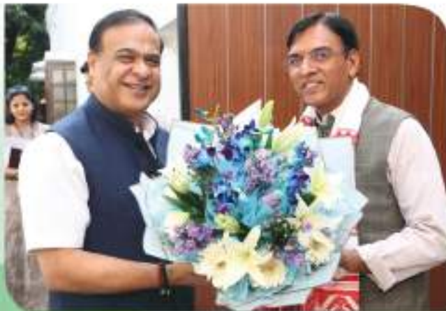
केन्द्रीय मन्त्री माननीय श्रीयुत ड॰ मनकुष मन्दीवीया डाडवीयाक साक्षात् कवा मुहूर्त मुख्यामन्त्री ड॰ हिमन्त विश्व शर्मा डाडवीया