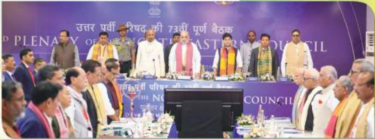
श्लिष्टत अनुष्ठित 'उत्तर-पूरु परिषद' ७३ संख्यक पूर्णस अधिवेशनत उपस्थित केन्द्रीय गृहमन्त्री तथा 'उत्तर-पूरु परिषद' अध्याक्ष सम्मानिय श्रीयुत अमित श्वाह डाडवीया