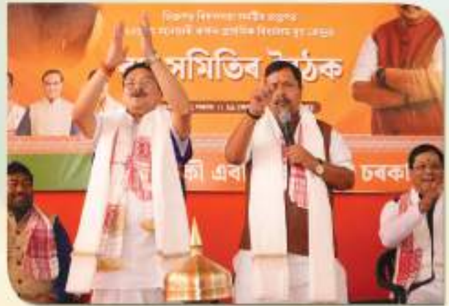
ডিব্ৰুগড়ত অনুষ্ঠিত বৃহৎ সমিতিৰ বৈঠকত অংশগ্ৰহণ কৰে ৰাষ্ট্ৰীয় সভাপতি মাননীয় শ্ৰীযুত নীতিন নৰীন ডাঙৰীয়াই