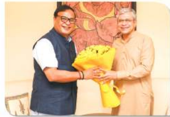
কেন্দ্ৰীয় কেবিনেট মন্ত্ৰী মাননীয় শ্ৰীযুত অশ্বিন বৈষ্ণৱ ডাঙৰীয়াক সাক্ষাৎ অসমৰ মাননীয় মুখ্যমন্ত্ৰী ড° হিমন্ত বিশ্ব শৰ্মা ডাঙৰীয়াৰ