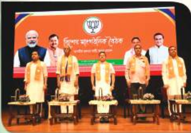
শ্ৰীশ্ৰী মামোদৰ দেৱ প্ৰফাগ্ৰহত অনুষ্ঠিত বিজেপি অসম প্ৰদেশৰ বিশেষ সাংগঠনিক সভাৰ এক মুহূৰ্ত