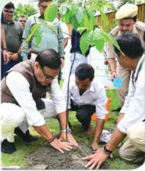
বিশ্ব পৰিবেশ দিৱস উপলক্ষে কল্ৰক্ষৰ গছ পুলি ৰোপণ কৰে মাননীয় মুখ্যমন্ত্রী ড° হিমন্ত বিশ্ব শৰ্মা ডাঙৰীয়াই