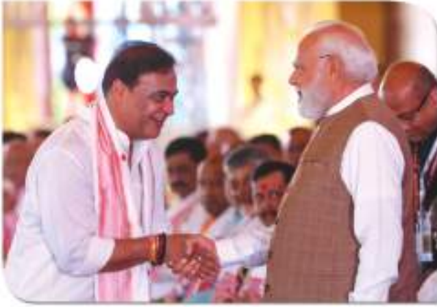
প্ৰধানমন্ত্ৰী শ্ৰীযুত নৰেন্দ্ৰ মোদী ডাঙৰীয়াই মুখ্যমন্ত্ৰী ড° হিমন্ত বিশ্ব শৰ্মাক শুভেচ্ছা জ্ঞাপন কৰা এক মুহূৰ্ত