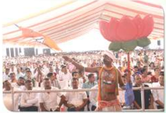
ঐতিহাসিক শপত গ্ৰহণ অনুষ্ঠানত বৃহৎ পৰিসৰত উপস্থিত হোৱা শুভাকাংক্ষী জনসাধাৰণ ৰাইজৰ তথা কাৰ্যকৰ্তা বৃন্দ