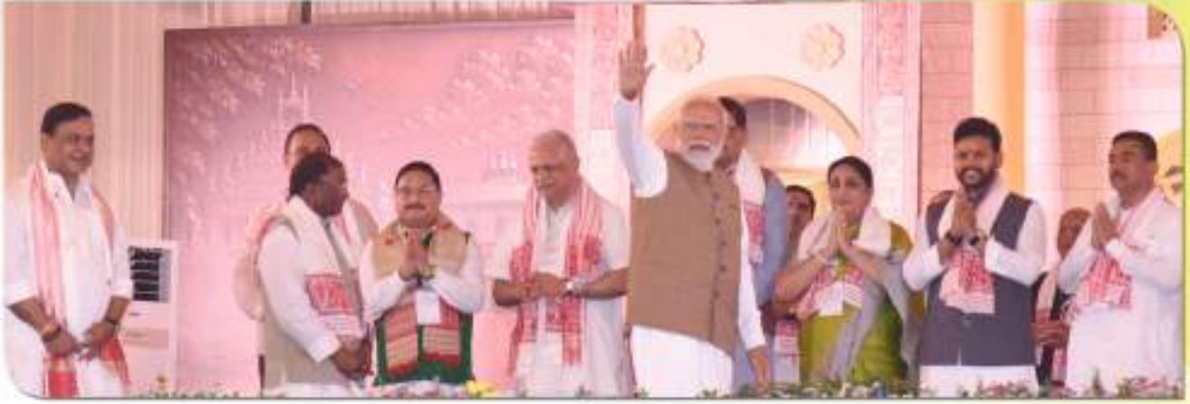
বিজেপি চৰকাৰৰ তৃতীয়টো কাৰ্যকালৰ শপত গ্ৰহণ অনুষ্ঠানত উপস্থিত হয় প্ৰধানমন্ত্ৰী শ্ৰীযুত নৰেন্দ্ৰ মোদী ডাঙৰীয়া আৰু এন.ডি.এ মিত্ৰজোঁটৰ ৰাষ্ট্ৰীয় নেত্ৰ