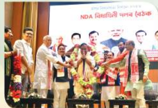
বিধায়নী দলৰ নেতা নিৰ্বাচিত হোৱাৰ পিছত মিত্ৰজোডিৰ সতীৰ্থ তথা কাৰ্যকৰ্তা সকলৰ দ্বাৰা ড° হিমন্ত বিশ্ব শৰ্মাক আদৰণি