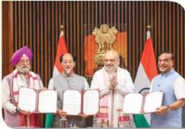
কেন্দ্ৰীয় গৃহমন্ত্ৰী শ্রীযুত অমিত শ্বাহ ডুঙৰীয়াৰ উপস্থিতিত উত্তৰ-পূৰ্বাঞ্চলৰ তেল তথা গেছ অন্বেষণৰ পথ প্ৰস্তু কৰি ভাৰত চৰকাৰ, অসম চৰকাৰ আৰু নাগালেণ্ড চৰকাৰ মাজত এক ঐতিহাসিক তৃপাত্ৰিক চুক্তি স্বাক্ষৰিত হয়।