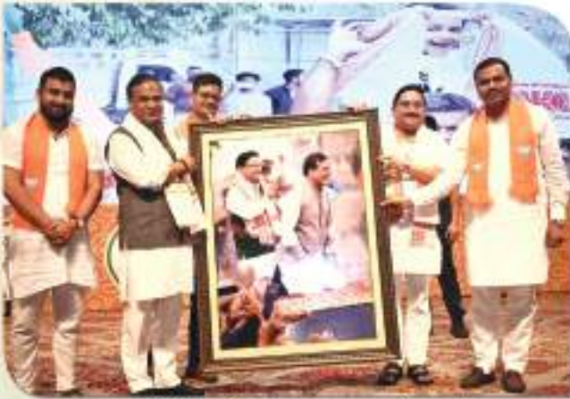
আমাৰ দলৰ নৱনিৰ্বাচিত বিধায়ক সকলৰ সন্মোৰ্ধনা অনুষ্ঠানত মুখ্যমন্ত্ৰী ড° হিমন্ত বিশ্ব শৰ্মা ডাঙৰীয়াৰ সৈতে ৰাজ্যিক সভাপতি দিলীপ শইকীয়া ডাঙৰীয়া আৰু ৰাজ্যিক সমিতিৰ বিষয়াবীয়া সকল