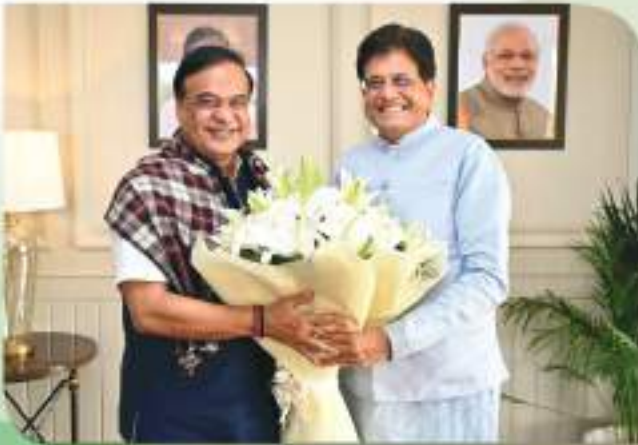
কেন্দ্ৰীয় মন্ত্ৰী মাননীয় শ্ৰীযুতা পিঙ্গু সোণোৱাল ডাঙৰীয়াক সাক্ষাৎ অসমৰ মাননীয় মুখ্যমন্ত্ৰী ড° হিমন্ত বিশ্ব শৰ্মা ডাঙৰীয়াৰ