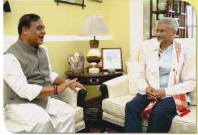
কেন্দ্ৰীয় কেবিনেট মন্ত্ৰী মাননীয় শ্ৰীযুত এচ. জয়শংকৰ ডাঙৰীয়াক সাক্ষাৎ অসমৰ মাননীয় মুখ্যমন্ত্ৰী ড° হিমন্ত বিশ্ব শৰ্মা ডাঙৰীয়াৰ