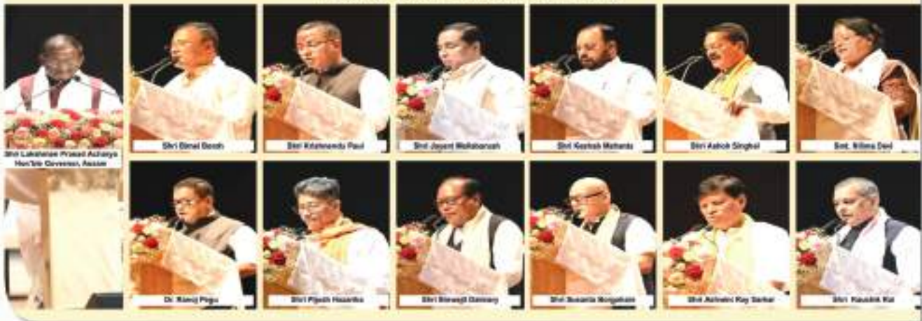
ৰাজ্য চৰকাৰৰ কেবিনেট মন্ত্ৰীসভাৰ ১২ গৰাকী মন্ত্ৰীৰ শপত গ্ৰহণ কৰা মুহূৰ্তসমূহ