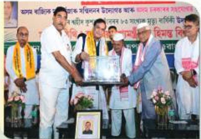
মুখ্যমন্ত্ৰী ড° হিমন্ত বিশ্ব শৰ্মাই স্বাধীনতা সংগ্ৰামী স্বহীদ কুশল কোৱৰৰ ৮৩ সংখ্যক মৃত্যু তিথি 'স্বহীদ দিৱস' উপলক্ষে আয়োজিত অনুষ্ঠানত তেওঁৰ প্ৰতি গভীৰ শ্ৰদ্ধাঞ্জলি অৰ্পন কৰাৰ লগতে স্বাধীনতা সংগ্ৰামী সকল সম্বোধনা জনাই