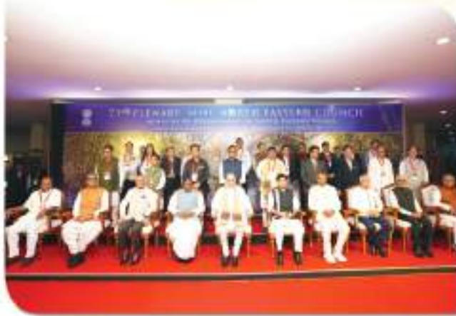
केन्द्रीय गृहमन्त्री तथा 'उत्तर-पूरु परिषद' अध्याक्ष माननीय श्रीयुत अमित श्वाह डाडवीयास सैते उत्तर-पूरु परिषद' सम्मानिय सदस्यकुन्द