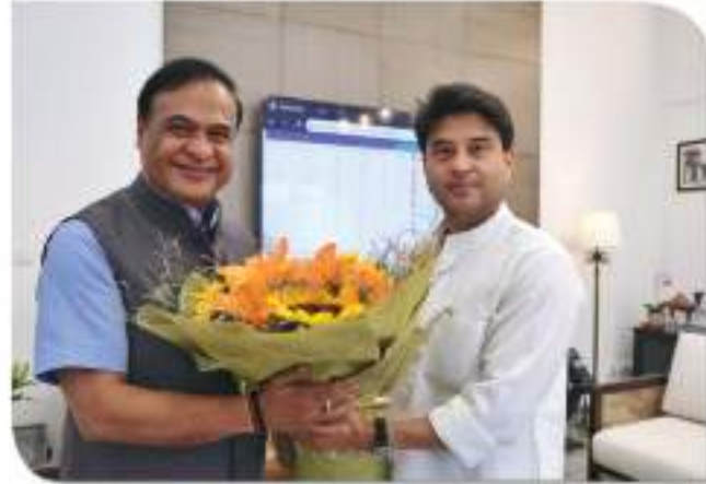
केन्द्रीय मन्त्री माननीय श्रीयुत ज्योतिबादित्य निक्षीया डाडवीयाक साक्षात् कवा मुहूर्त मुख्यामन्त्री ड॰ हिमन्त विश्व शर्मा डाडवीया