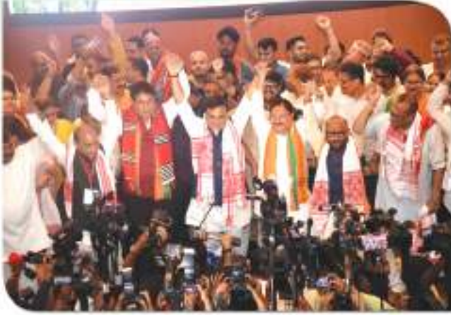
২০২৬ চনৰ বিধান সভা নিৰ্বাচনৰ ফলাফল ঘোষণাৰ পিছত বিজেপিৰ মুখ্যকাৰ্যালয়ত ড° হিমন্ত বিশ্ব শৰ্মা সংবাদমেল সন্মোহন