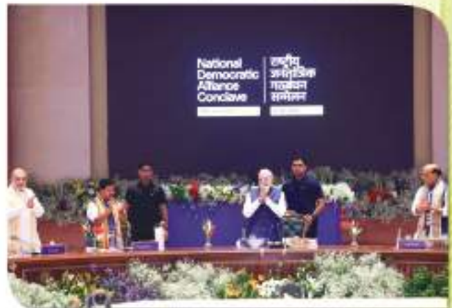
নতুন দিল্লীত অনুষ্ঠিত এন.ডি.এ মিত্ৰজোঁটৰ সমাৰোহত অংশগ্ৰহণ কৰে প্ৰধানমন্ত্ৰী শ্রীযুত নরেন্দ্র মোদী ডাঙৰীয়াই