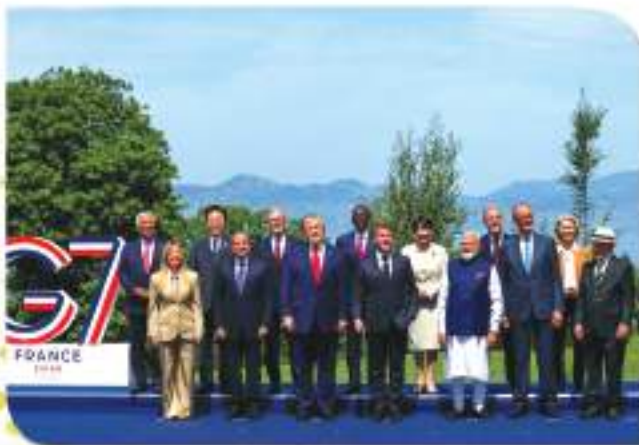
এভিয়ানত অনুষ্ঠিত জি-৭ সন্মিলনত সতীৰ্থ নেতাসকলৰ সৈতে ভাৰতৰ প্ৰধানমন্ত্ৰী শ্রীযুত নরেন্দ্র মোদী ডাঙৰীয়া