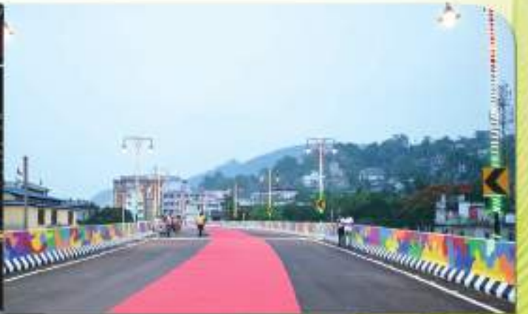
ড°শ্যামাপ্ৰসাদ মুখাৰ্জী উৰবীয়া সেতু উদ্বোধন কৰাৰ মুহূৰ্ত্ত অসমৰ মাননীয় মুখ্যমন্ত্রী ড° হিমন্ত বিশ্ব শৰ্মা ডাঙৰীয়া আৰু অন্যান্য দলীয় কার্যকর্তা সকল