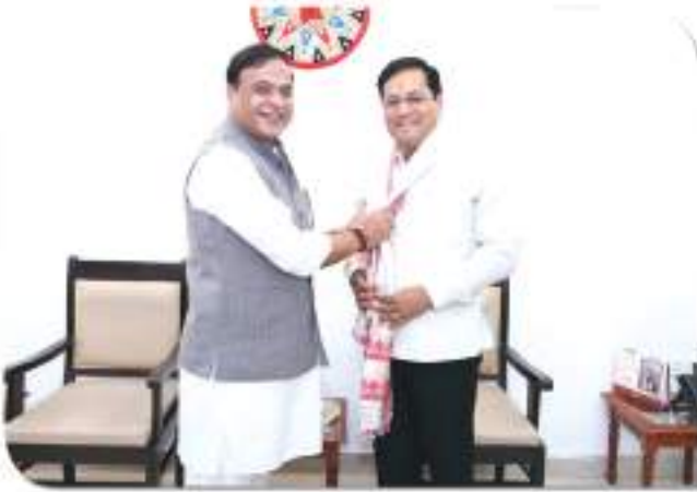
কেন্দ্ৰীয় কেবিনেট মন্ত্ৰী মাননীয় শ্ৰীযুত সৰ্বানন্দ সোণোৱাল ডাঙৰীয়াক সাক্ষাৎ অসমৰ মাননীয় মুখ্যমন্ত্ৰী ড° হিমন্ত বিশ্ব শৰ্মা ডাঙৰীয়াৰ