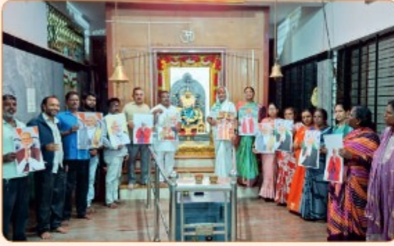
ಹುಬ್ಬಳ್ಳಿ - ಧಾರವಾಡ