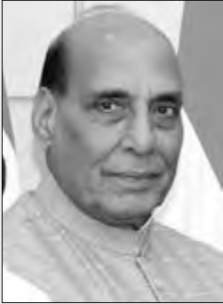
രാജ്നാഥ് സിംഗ് - കേന്ദ്ര പ്രതിരോധമന്ത്രി

'ഇന്ത്യയുടെ ചരിത്രത്തിലെ ഏറ്റവും കൂടുതൽ കാലം തിരഞ്ഞെടുക്കപ്പെട്ട പ്രധാനമന്ത്രിയായി 4399 ദിവസം പൂർത്തിയാക്കിയ നരേന്ദ്ര മോദിജിക്ക് അഭിനന്ദനങ്ങൾ. രാഷ്ട്രം ആദ്യം എന്ന തത്വത്താൽ നയിക്കപ്പെടുന്ന അക്ഷീണനായ കർമ്മയോഗിയുടെ കാലാവധി ഇന്ത്യയോടുള്ള അചഞ്ചലമായ സമർപ്പണത്തെയും, ജനങ്ങളുടെ ക്ഷേമത്തിനായുള്ള അചഞ്ചലമായ പ്രതിബദ്ധതയെയും, രാഷ്ട്രസേവനത്തിലെ പരിവർത്തനാത്മക നേതൃത്വത്തെയും പ്രതിഫലിപ്പിക്കുന്നു. ഈ നേട്ടം ഇന്ത്യയിലെ ജനങ്ങൾ അദ്ദേഹത്തിന്റെ നേതൃത്വത്തിൽ അർപ്പിച്ച വിശ്വാസത്തിനും എല്ലാവരെയും ഉൾക്കൊള്ളുന്ന വികസനത്തിനും സർഭരണത്തിനും വേണ്ടിയുള്ള അദ്ദേഹത്തിന്റെ അശ്രാന്ത പരിശ്രമത്തിന് തെളിവാണ്. കഴിഞ്ഞ പുനഃ വർഷത്തിനിടയിൽ, വികസനത്തിലും ആഗോള നേതൃത്വത്തിലും ഇന്ത്യ ശ്രദ്ധേയമായ പുരോഗതി കൈവരിച്ചു. വികസിത ഭാരതത്തിന്റെ ലക്ഷ്യത്തിലേക്ക് ഇന്ത്യ മുന്നേറുമ്പോൾ 'പ്രധാനമന്ത്രി മോദി രാജ്യത്തെ കൂടുതൽ അഭിവൃദ്ധിയിലേക്കും പുരോഗതിയിലേക്കും ആഗോള പ്രാധാന്യത്തിലേക്കും നയിക്കുന്നത് തുടരുന്നൂ.'