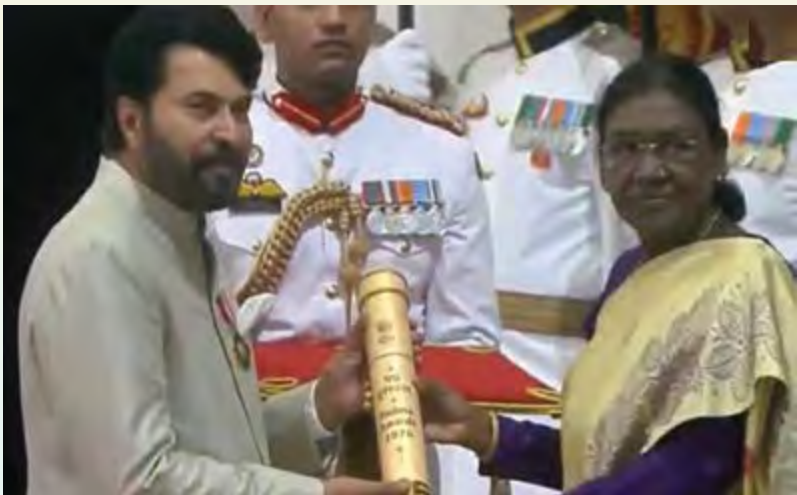
പത്മഭൂഷൺ പുരസ്കാരം രാഷ്ട്രപതി ദ്രൗപദി മുർമുവിൽ നിന്ന് ശ്രീ മമ്മൂട്ടി സ്വീകരിക്കുന്നു