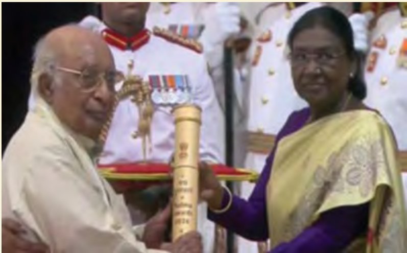
പത്മവിഭൂഷൺ പുരസ്കാരം രാഷ്ട്രപതി ദ്രൗപദി മുർമുവിൽ നിന്ന് മുൻ ജസ്റ്റിസ് കെ.ടി. തോമസ് സ്വീകരിക്കുന്നു