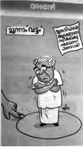
കാർട്ടൂൺ: മലയാള മനോരമ

കോടതി വിധികളെ വല്ലാതെ സ്നേഹിച്ചു പോകുന്ന അവസരങ്ങളുണ്ട്. നിസ്സഹായരായ മനുഷ്യരുടെ അവസാനത്തെ അഭയകേന്ദ്രമെന്ന നിലയിൽ കോടതികളുടെ പ്രസക്തി വളരെയേറെയാണ് ജനാധിപത്യ സംവിധാനത്തിൽ കോടതികളുടെ ഇടപെടൽ ഉണ്ടായിരുന്നില്ലെങ്കിൽ എന്താകുമായിരുന്നു അവസ്ഥയെന്ന് ചിന്തിച്ചിട്ടുണ്ടോ? ഏതായാലും സുപ്രീം കോടതിയിൽ നിന്ന് അടുത്തിടെയുണ്ടായ വിധിയും പരാമർശങ്ങളും അതീവ ശ്രദ്ധയാകർഷിക്കുന്നതും സമൂഹത്തിന്റെ വളർച്ചയ്ക്കും സമാധാനത്തിനും ഏറെ പ്രധാനപ്പെട്ടതുമാണ്.