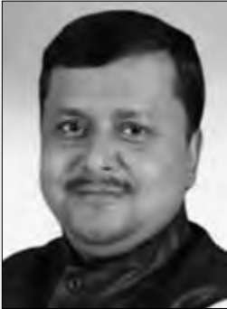
നിതിൻ നബിൻ - ബിജെപി ദേശീയ പ്രസിഡന്റ്

'പുനഃ വർഷങ്ങൾക്ക് മുമ്പ്, ബഹുമാനപ്പെട്ട പ്രധാനമന്ത്രി നരേന്ദ്ര മോദിജി ഇന്ത്യയുടെ പ്രധാനമന്ത്രിയായി സത്യപ്രതിജ്ഞ ചെയ്ത് സേവനം, സർഭരണം, പൊതുജനക്ഷേമം എന്നിവ അടിസ്ഥാനമാക്കിയുള്ള ഒരു പുതിയ യുഗത്തിന് തുടക്കമിട്ടു. രാജ്യത്തിന്റെ ചരിത്രത്തിൽ ഏറ്റവും കൂടുതൽ കാലം ജനാധിപത്യപരമായി തിരഞ്ഞെടുക്കപ്പെട്ട പ്രധാനമന്ത്രിയായി ബഹുമാനപ്പെട്ട പ്രധാനമന്ത്രി മാറി. ഈ കാലയളവിൽ, ദരിദ്രരുടെ ക്ഷേമം, കർഷകരുടെ അഭിവൃദ്ധി, സ്ത്രീ ശാക്തീകരണം, യുവാക്കൾക്കുള്ള അവസരങ്ങൾ. ആരോഗ്യ സൗകര്യങ്ങളുടെ വികസനം, ഡിജിറ്റൽ പരിവർത്തനം, അടിസ്ഥാന സൗകര്യങ്ങളുടെ അഭ്യുത്ഥനപരമായ വികസനം എന്നിവയിൽ പുതിയ ചലനാത്മകത ഉണ്ടായിട്ടുണ്ട്. ആർട്ടിക്കിൾ 370 ന്റെ ചരിത്രപരമായ നദ്രാക്കൽ, ശ്രീരാമ ജന്മഭൂമി ക്ഷേത്രത്തിന്റെ നിർമ്മാണം, ശാശ്വത സാംസ്കാരിക പൈതൃകത്തിന്റെ പുനഃസ്ഥാപനം എന്നിവ രാജ്യത്തിന്റെ സ്വത്വത്തിലും ആത്മാഭിമാനത്തിലും സാംസ്കാരിക അവബോധത്തിലും പുതിയ ഊർജ്ജം പകർന്നു. ഈ പരിവർത്തന യാത്രയുടെ കാതൽ പ്രധാനമന്ത്രി മോദിജിയുടെ 'പ്രധാന സേവകൻ' എന്ന സങ്കല്പവും ധർമ്മികതയും സേവനത്തോടുള്ള അചഞ്ചലമായ പ്രതിബദ്ധതയുമാണ്. ഈ ചൈതന്യത്തിൽനിന്ന് പ്രചോദനം ഉൾക്കൊണ്ട് നാമെല്ലാവരും വികസിത ഇന്ത്യ 2047 എന്ന കൂട്ടായ സ്വപ്നം സാക്ഷാത്കരിക്കാൻ പ്രവർത്തിക്കുമെന്ന് പൂർണ്ണമായും ദൃഢനിശ്ചയം ചെയ്തിരിക്കുന്നു.