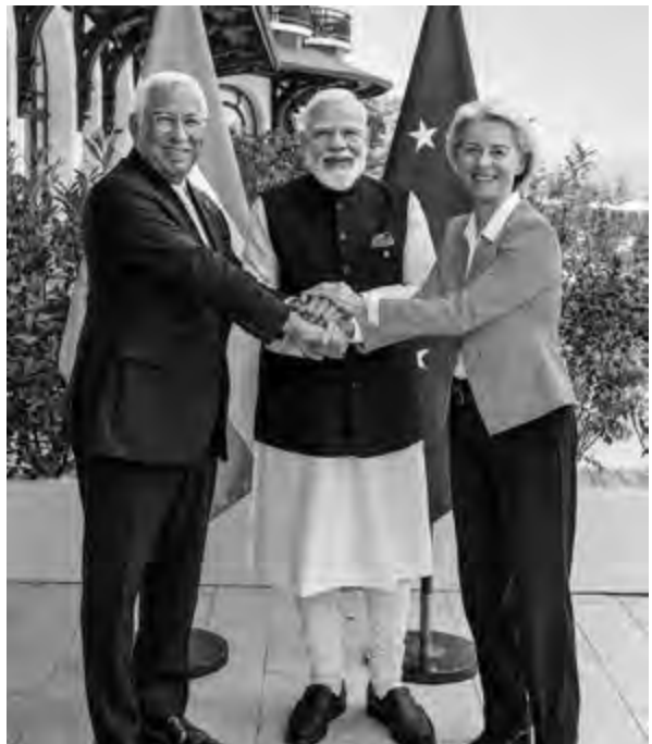
യൂറോപ്യൻ കൗൺസിൽ പ്രസിഡന്റ് അന്റോണിയോ കോസ്റ്റ, യൂറോപ്യൻ കമ്മീഷൻ പ്രസിഡന്റ് ഉർസുല വോൺ ഡെർ ലെയ്നുമായി പ്രധാനമന്ത്രി നരേന്ദ്ര മോദി ഫ്രാൻസിലെ ഇവിയാനിൽ നടന്ന ജി 7 ഉച്ചകോടിയിൽ കിടയിൽ

ഈ പശ്ചാത്തലത്തിൽ ചൈനയ്ക്ക് തന്ത്രപരമായ ഒരു ബദലായാണ് ആഗോള വേദിയിൽ ഭാരതം ഉയർന്നുവരുന്നത്. പ്രധാനമന്ത്രി നരേന്ദ്ര മോദിയുടെ ജൂൺ 13 മുതൽ 18 വരെ നീണ്ടു നിന്ന ഫ്രാൻസ്, സ്ലൊവാക്യ സന്ദർശനവും എവിയാനിൽ നടന്ന ജി7 ഉച്ചകോടിയിലെ പങ്കാളിത്തവും കേവലം ഒരു ഔപചാരിക നയതന്ത്ര യാത്രയല്ല. മറിച്ച്, അത് യൂറോപ്പും ഭാരതവും തമ്മിൽ വളരുന്ന തന്ത്രപരമായ ബന്ധത്തിന്റെ അടയാളപ്പെടുത്തലായിരുന്നു. അമേരിക്കയും യൂറോപ്പും തമ്മിലുള്ള സാമ്പത്തിക അനിശ്ചിതത്വങ്ങൾ വർദ്ധിക്കുകയും ബെയ്ജിംഗുമായുള്ള വ്യാപാര