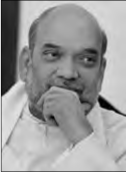
അമിത് ഷാ - കേന്ദ്ര ആഭ്യന്തര, സഹകരണ മന്ത്രി

'രാജ്യത്ത് ഏറ്റവും കൂടുതൽ കാലം തിരഞ്ഞെടുക്കപ്പെട്ട പ്രധാനമന്ത്രിയായി ജനങ്ങളെ സേവിക്കുക എന്ന ചരിത്രപരമായ നാഴികകല്ല് നേടിയ ബഹുമാനപ്പെട്ട പ്രധാനമന്ത്രി നരേന്ദ്ര മോദിജിക്ക് ഹൃദയംഗമമായ അഭിനന്ദനങ്ങളും ആശംസകളും. മോദിജിയുടെ ഈ 12 വർഷങ്ങൾ ഇന്ത്യയുടെ അഭിമാനത്തെയും സാംസ്കാരിക നവോത്ഥാനത്തെയും പുനഃസ്ഥാപിക്കുന്നതിനും രാജ്യത്തെ അടിമത്തത്തിന്റെ മാനസികാവസ്ഥയിൽ നിന്ന് മോചിപ്പിക്കുന്നതിനുമുള്ളതാണ്. പുതിയ പാർലമെന്റ് നിർമ്മിക്കപ്പെട്ടു, മൂന്ന് പുതിയ നിയമങ്ങൾ നടപ്പിലാക്കി, പുതിയ വിദ്യാഭ്യാസ നയം, മാതൃഭാഷകളിൽ ഫൈനൽ, എഞ്ചിനീയറിംഗ് വിദ്യാഭ്യാസത്തിന് വഴിയൊരുക്കി, ആത്മനിർഭര ഭാരത് ഓരോ ഇന്ത്യക്കാരന്റെയും ദൃഢനിശ്ചയമായി മാറി. പൗരന്മാരുടെ സുരക്ഷ ഉറപ്പാക്കുകയും അവരുടെ നഷ്ടപ്പെട്ട ആത്മാഭിമാനവും ബഹുമാനവും പുനഃസ്ഥാപിക്കുകയും ചെയ്യുക എന്നതാണ് മോദിജിയുടെ ഏറ്റവും വലിയ നേട്ടം. ഇന്ന്, പുതിയ ഇന്ത്യ എല്ലാ ആഗോള വേദികളിലും ആത്മവിശ്വാസത്തോടെ അതിന്റെ ഐഡന്റിറ്റി സ്ഥാപിക്കുകയാണ്. കൂടാതെ ലോകം കഴിവുള്ള, ശക്തനായ, പുതിയ ഇന്ത്യയുടെ ഉദയത്തിന് സാക്ഷ്യം വഹിക്കുകയാണ്.