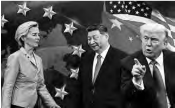
യൂറോപ്യൻ കമ്മീഷൻ പ്രസിഡന്റ് ഉർസുല വോൺ ഡെർ ലെയ്ൻ, ചൈനീസ് പ്രസിഡന്റ് ഷി ജിൻപിംഗ്, യുഎസ് പ്രസിഡന്റ് ഡൊണാൾഡ് ട്രംപ്

ഭാരതത്തിന്റെ സ്ഥിരതയാർന്ന സാമ്പത്തിക വളർച്ചയും യൂറോപ്യൻ ബിസിനസുകളെ ആകർഷിക്കുന്ന ഘടകമാണ്. 2025-ൽ