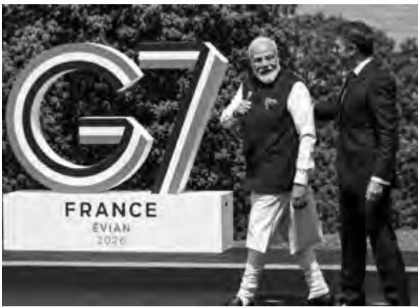
ഫ്രാൻസിലെ ഇവിടാനിൽ നടന്ന ജീ7 ഉച്ചകോടിയിൽ ഫ്രാൻസ് പ്രസിഡന്റ് എമാനുവേൽ മാക്രോണിനൊപ്പം പ്രധാനമന്ത്രി നരേന്ദ്ര മോദി

തർക്കങ്ങൾ മുൻപെടുത്തിയതിനുശേഷം രൂക്ഷമാവുകയും ചെയ്യുന്ന ഈ ഘട്ടത്തിൽ, പ്രധാനമന്ത്രിയുടെ ഈ സന്ദർശനം ഏറെ പ്രാധാന്യമർഹിക്കുന്നു.